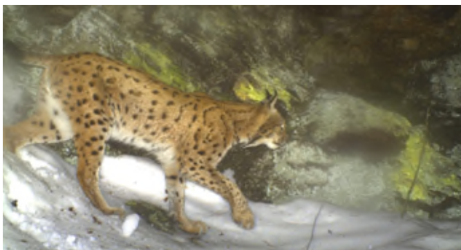
Der Luchs B3, fotografiert an einem Standort, an dem auch schon B2 erfasst worden ist. Er ist erst seit diesem Durchgang bekannt.

Da ist das seit Juli 2008 bekannte Luchsweibchen B2. Es führte im Oktober 2009 noch zwei Junge. Ab Ende November konnte nur noch ein Junges nachgewiesen werden. Durch mittlerweile 15 Erfassungen im Laufe des intensiven und opportunistischen Fotofallen-Monitorings kann das ungefähre Streifgebiet von B2 relativ gut abgegrenzt werden. Sie bewegt sich zwischen dem Lamer Winkel, dem Kaitersberg-Massiv und dem Arbergebiet bei Bodenmais. Damit stimmt ihr Territorium recht genau mit jenem überein, das über Radtotelemetrie für die Luchsin „Andra“ in den Jahren 2001/2002 ermittelt wurde.