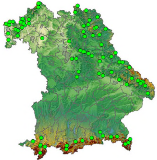
Die Grafik zeigt die Verteilung der Mitglieder des Netzwerks Große Beutegreifer in Bayern.

Gibt es für sie hinreichende Verdachtsmomente auf Luchs, Wolf oder Bär als Verursacher veranlassen sie, dass der Tierkörper von einem Amtstierarzt in der zuständigen Tierkörperbeseitigungsanstalt seziiert wird. Bestätigt sich hier der Anfangsverdacht, zahlt die Trägergemeinschaft aus.