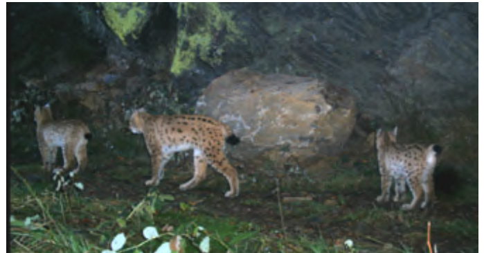
Die Luchsin L4 mit ihren zwei Jungen östlich von Bodenmais im Oktober 2009. Sie nutzt auch das Falkensteiner Gebiet im Nationalpark.

Schließlich wurde im inneren Bayerischen Wald ein weiteres Luchsweibchen, L4, erfasst. Es wurde erstmals im Mai 2009 bei Bayerisch-Eisenstein fotografiert. Da damals der Bauch verdächtig dick erschien, lag der Schluss nahe, dass es sich um ein trächtiges Weibchen handeln musste. Der Nachweis gelang aber erst Ende Oktober 2009 durch das bisher wohl schönste Fotofallenbild: sie und ihre zwei halbwüchsigen Jungen auf einem Bild.